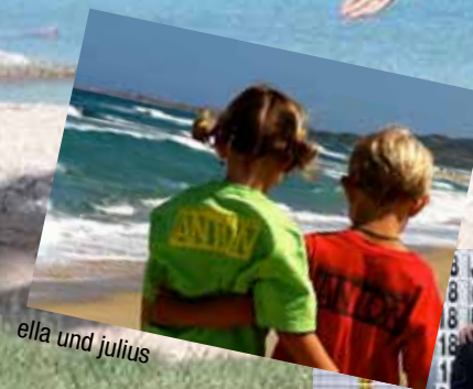
ella und julius