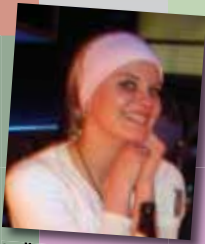
evelin der gute geist des hauses