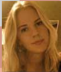
else commis im café