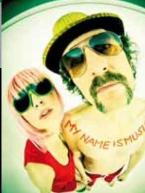
my name is music