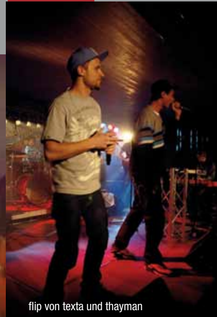
flip von texta und thaiman