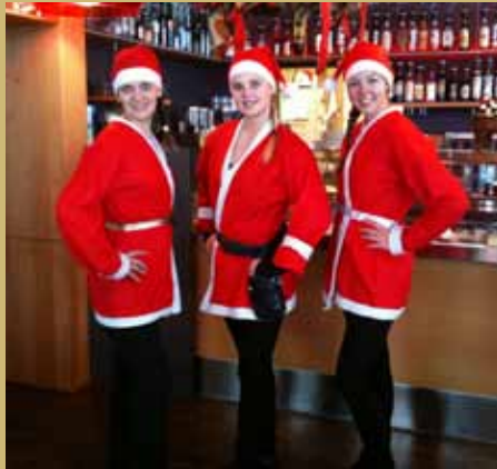
unser team / our team