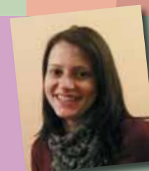
ines rezeption + service