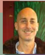
achaz in der bar