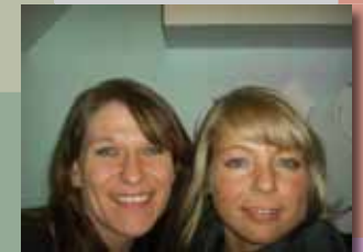
vivien küche jasmin bar